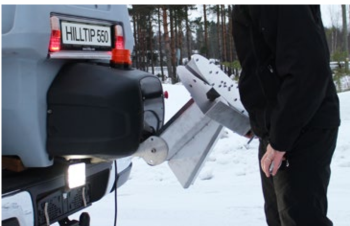
Plus model med opklappelig spredetallerken af rustfrit stål. Designet til spredning af salt med høj fugtighed