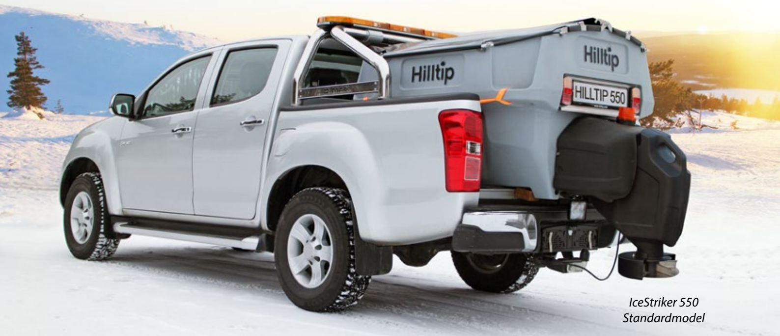
IceStriker 550 Standardmodel

Sprederen kan nemt omdannes til en komplet saltvæskesprøjte eller til en kombispredere med befugtning af spredematerialet. Integrerede tanke kan indeholde op til 450 l væske. Sprederen kan udstyres med en 2 meter spredébom eller en slangerulle med håndholdt sprøjtedyse.