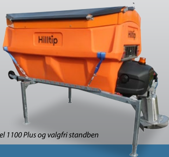
Model 1100 Plus og valgfri standben