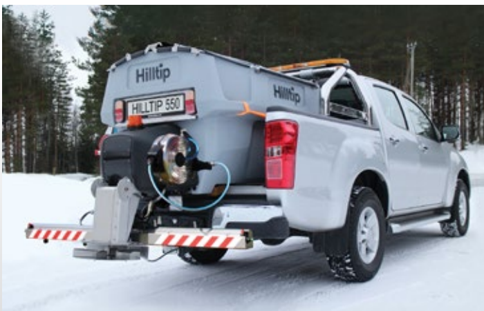
Valgfri spredebom og slangerulle